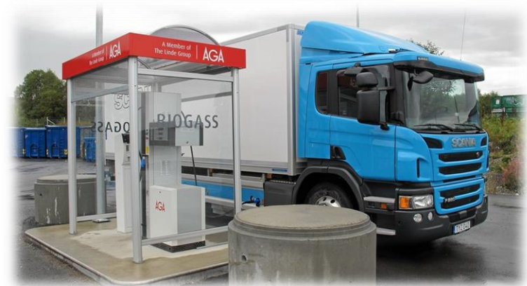
Illustrasjonsfoto: Moderne transport